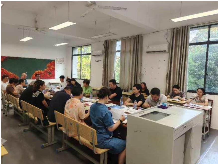
各专业毕业设计题库更新研讨会议

(2)2023年10月，专业带头人组织开展毕业设计题库更新研讨会议，落实每年选题更新不少于10%的要求。