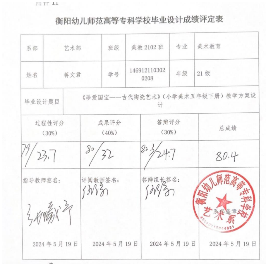
表 (2)2024 年 6 月 30 日前, 各毕业设计答辩小组提交毕业设计答辩记录