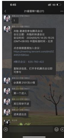
(2024年5月, 各小组分别建立2024届学生答辩腾讯会议)