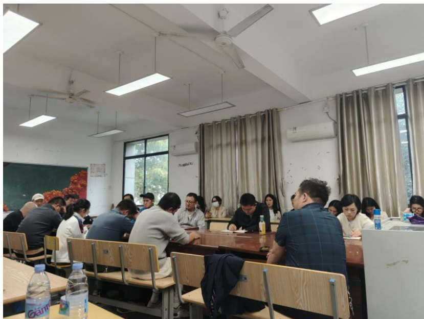
毕业设计标准研讨会议

(1)2023年10月10日—10月15日，学院根据省厅文件要求、学校毕业设计工作实施方案等要求，修订毕业设计标准。